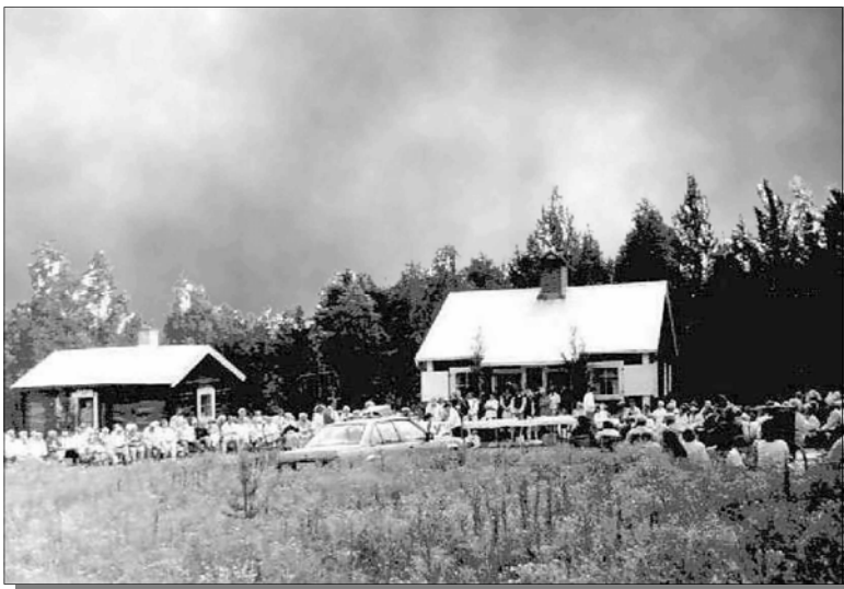
Bilden tagen av Ragnar Nydén Kragom Älandsbro

Fäbodsgudstjänst vid Kragoms fäbod, 1:a söndagen efter midsommar 2001.