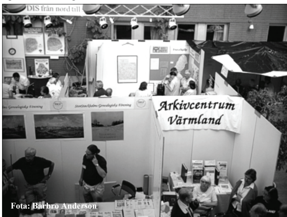
Vinterträdgården. Bakom Arkivcentrum Värmland syns DIS-Mitt.