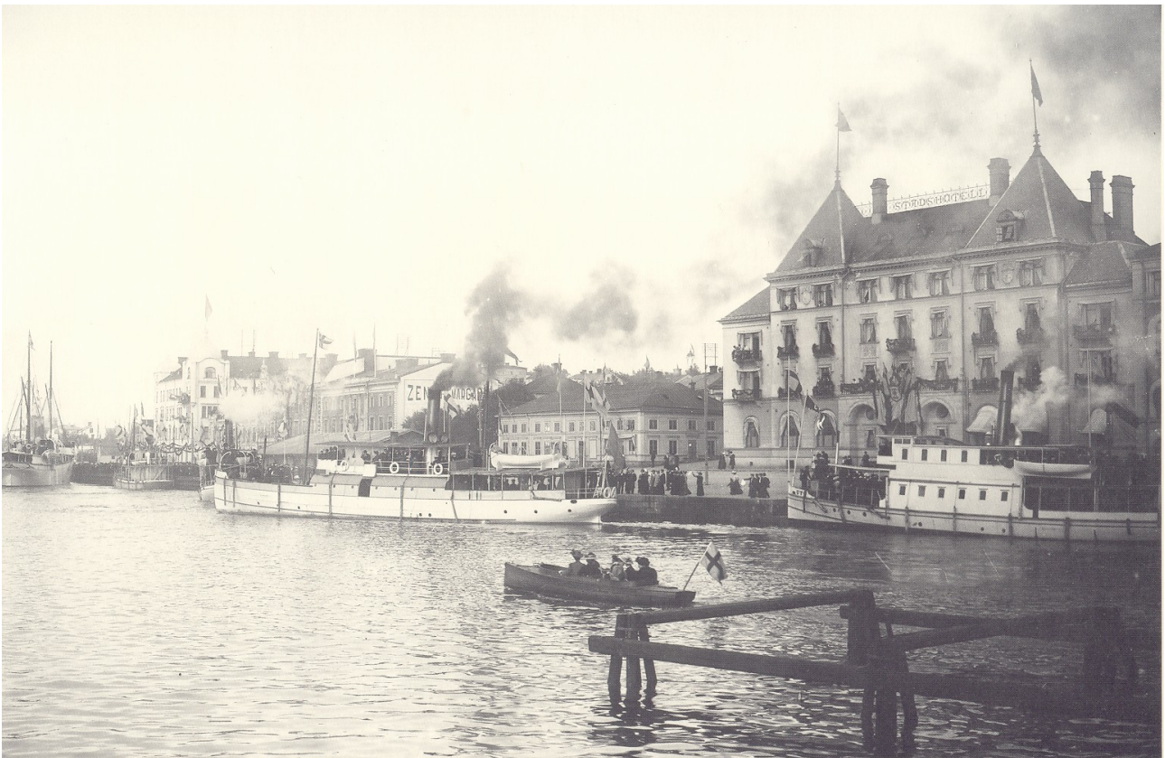
Vy över Härnösands hamn år 1908.

Byggnaden som dominerar bilden är det gamla stadshotellet som revs under senare delen av 1960-talet, eller tidigt 70-tal. Med dagens mått mått måste det väl betraktas som ett helgerån att riva en sådan vacker byggnad.