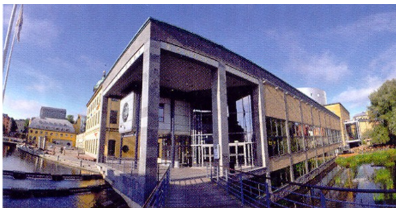
Louis De Geer Konsert och Kongress ligger direkt intill Motala Ström som flyter genom centrala Norrköping.

Mer information om dessa försäkringar finns på förbundets hemsida RÖTTER. www.genealogi.se . Under rubriken RIKS-FÖRBUNDET klickar du på "Förbunds-försäkring".