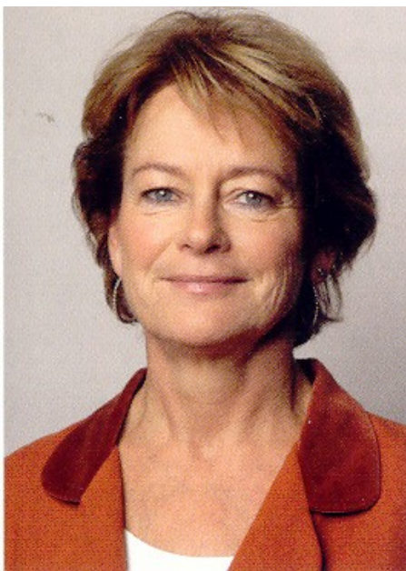
Lena Adelsohn Liljeroth. Sveriges kulturminister.

Ofta blir det barnbarnen som ställer frågorna om äldre släktingar och då kanske de inte finns. Då är det viktigt att kulturarvet finns nära människorna som kan berika genom lättillgängliga arkiv. Internationellt sett är det lätt att forska i Sverige och den nya digitala tekniken ger nya möjligheter. Lena berättade att släktforskningen är Sveriges största folkrörelse med tusentals medlemmar som gör att vi ligger i topp i Europa.