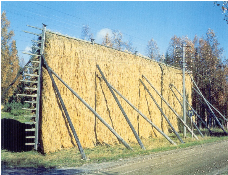
En ångermanländsk storhässja.

Sedvanliga årsmötesförhandlingar. Efter årsmötet föredrag av ännu ej fastställd person Kvällen avslutas med sedvanlig fikastund.