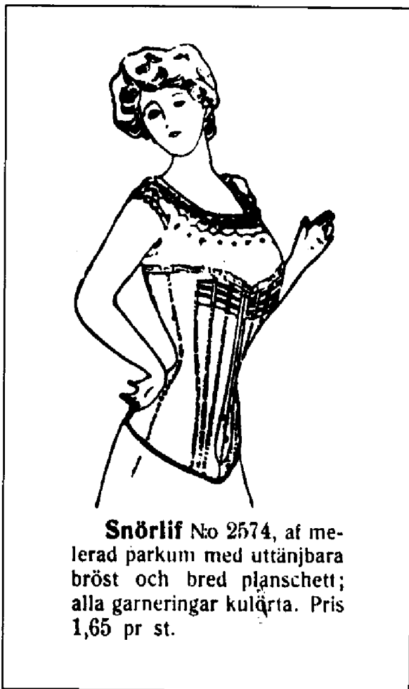
Snörlif No 2574, af me- lerad parkum med uttänjbara bröst och bred planschett; alla garneringar kulörta. Pris 1,65 pr st.

Allers mönstertidning kunde damerna köpa för 10