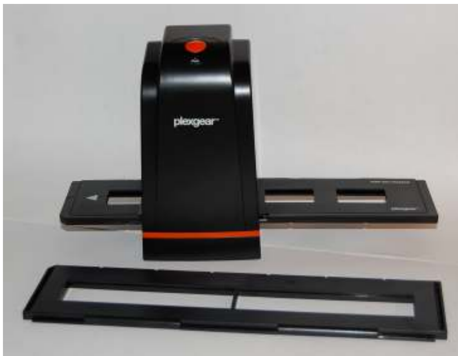
Bild 1. Skannern levereras med två olika filmhållare.

Sen hörde jag talas om någon som gjort en ljuslåda med en lampa bakom en opalfärgad glasskiva och sedan fotat av sina diabilder med digitalkameran. Även detta förkastade jag, eftersom det skulle ta för lång tid. Dessutom måste kameran gå att ställa in för tagning på mycket kort avstånd. För några år sedan hittade jag hos företaget Kjell & Company en speciell diabil-skanner. Den finns i olika utföranden och för både Mac och PC. Priserna varierar mellan 499 och 999 kronor. Efter en tids funderande slog jag till på den billigaste varianten. Den levereras komplett med USB-kabel, programvara och håll-