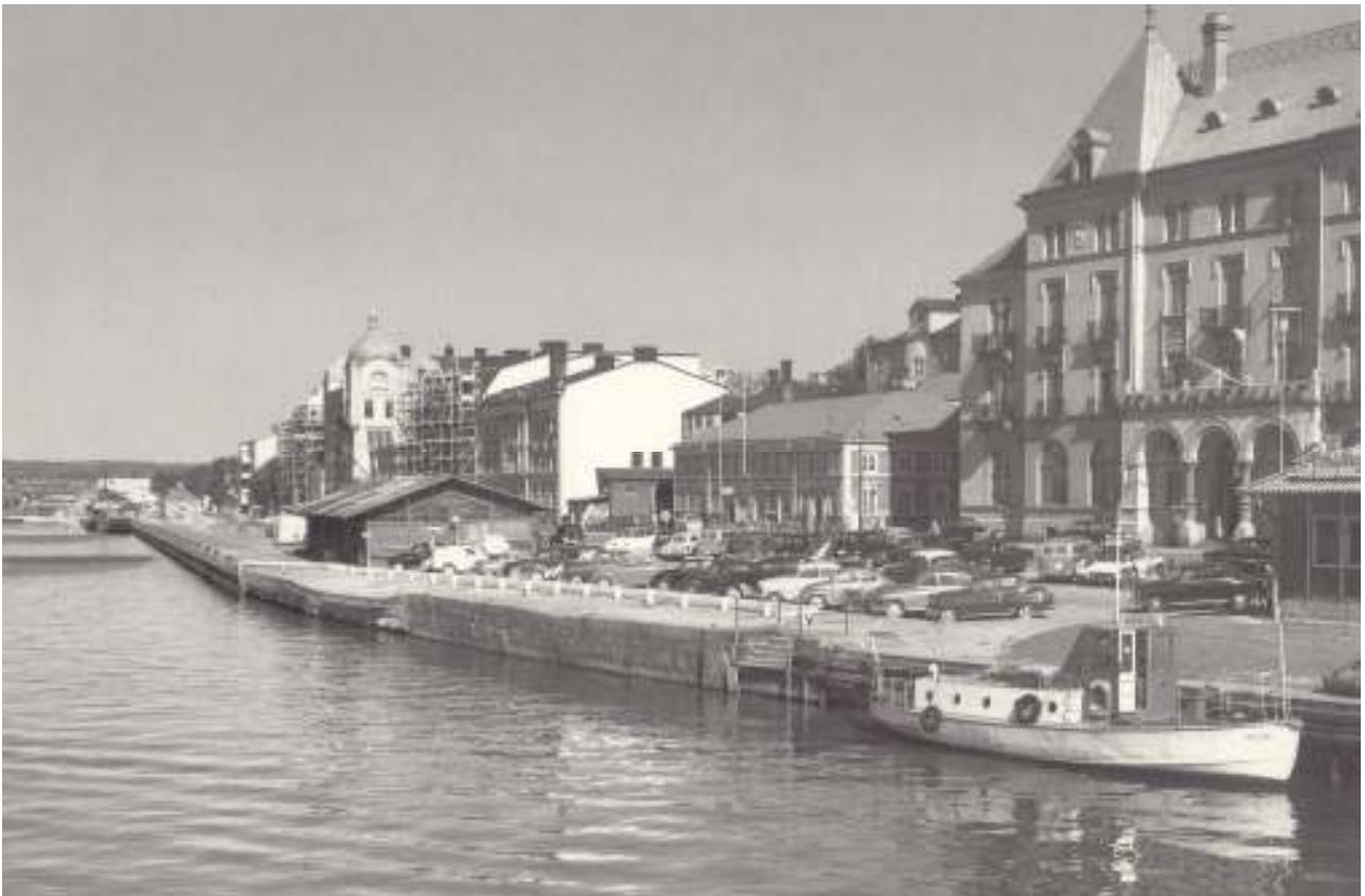
Vy över Härnösands hamn år 1958.

Nästan samma vy som på förra numret, men 50 år senare. Ytterst få människor syns här och alla fartygen är också borta. Enda fartyget som går att urskilja är lungöbåten Vidar. Den trafikerade Lungön under en period på 1950-talet. Är det någon av Bäfvernyttts läsare som vet något mer ingående om Vidar? Kontakta i så fall någon i styrelsen. Samma sak gäller den låga träbyggnad som på bilden ligger rakt nedanför det s.k. Tullhuset. Vad användes den byggnaden till?