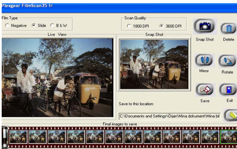
Bild 2. Användargränssnittet är lättförståeligt och intuitivt.

Installationen av programvaran är en snabb och enkel process. Sen är det bara att köra igång... För min egen del handlade det om c:a 1000 diabilder. När jag kommit fram till hur de skulle