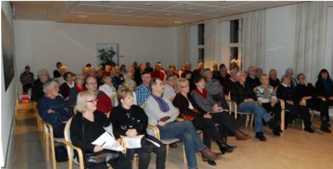
Nästan fullsatt i Mittnordensalden. Mer än 60 besökare denna decemberkväll.

förebyggande kunskaper bland hus byggda av trä. Telegrafverket visade hur man kunde räkna ut vad ett samtal mellan Stockholm och Härnösand kostade och SJ fanns med och gjorde reklam med orden: ”Se Sverige med tåg. Se Ditt land!”