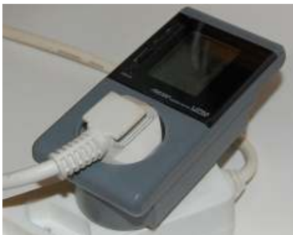
En enkel energimätare från Clas Ohlson användes vid mätningen.