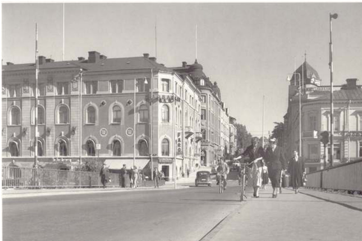
Nybron år 1956.

På denna bild har fotografen flyttat kameran till andra sidan gatan och något närmare järnvägsstationen (jämfört med bilden i förra numret). Samtidigt har han vridit kameran något åt höger. Detta för att få en vy över Härnösands "paradgata" - Nybrogatan. En en kilometer lång bred och rak gata som sträcker sig från järnvägsstationen i väster till Villa Nybo i öster.