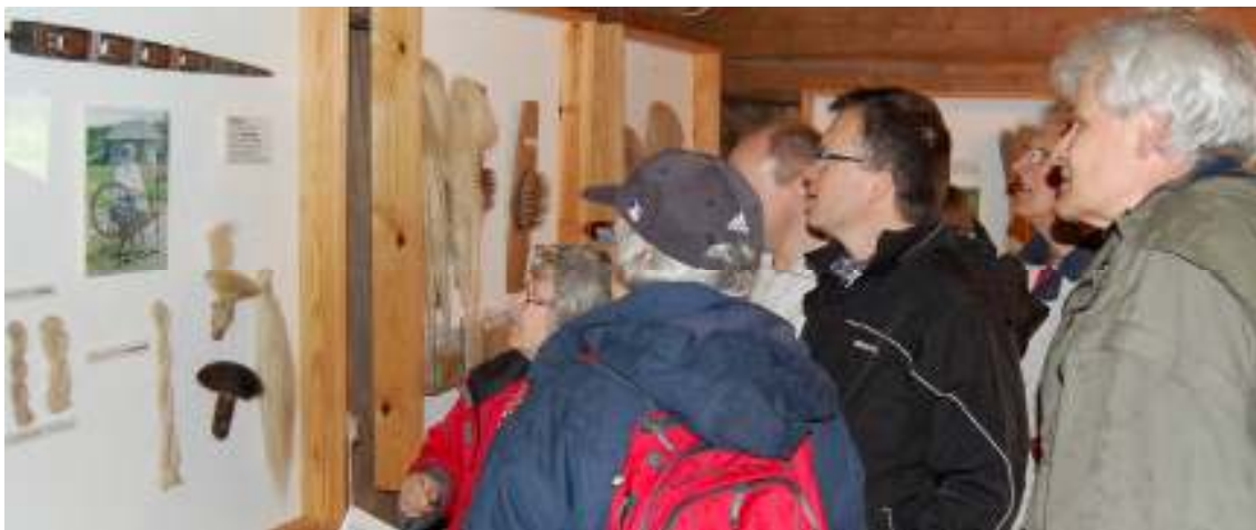
Intresset för linberedningens olika moment var stort.