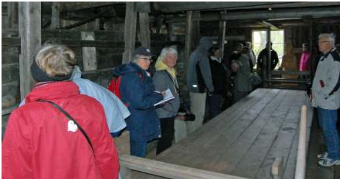
Interiör från mangelboden. På det stora bordet förbereddes väven för mangling. I bakgrunden syns den stenfyllda lådan som var "mangeltungd".