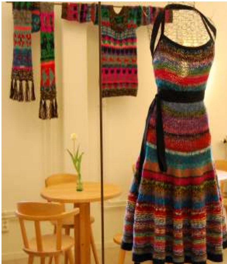
Stickkonst av den högre skolan. Fantastiska färger och former.

manlands landskapssöm med benämningen Anundsjösöm. Vi tittade i arkiven på många olika alster med Anundsjösöm men också andra vackra alster med rosengång, dräll, knyppling, hålkruis, virkning m.m.