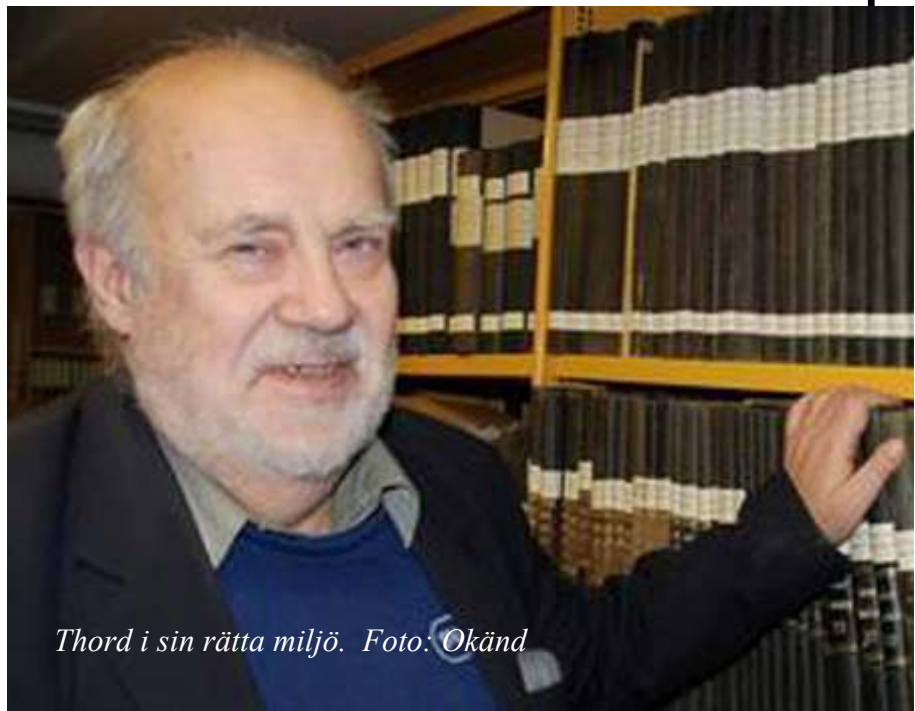
Thord i sin rätta miljö.

Vid sin militärtjänst i Stockholm träffar han av en slump en värnpliktig, född uppe i Backe, Fjällsjö. Han visar en för Thord fascinerande utredning.