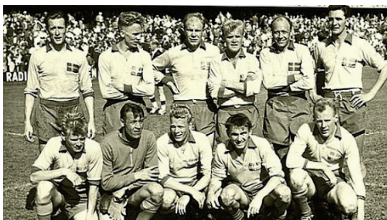
Fotbolls VM 1958