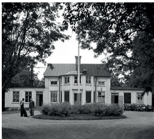
Lövuddens herrgård

/Från Härnösands kommuns naturvårdsprogram