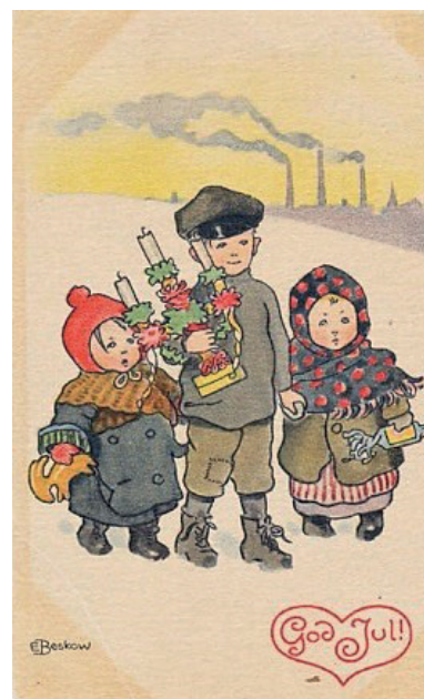
I väntan på julen

När man var färdiga samlades hela familjen vid bordet och far läste ur julevangeliet.