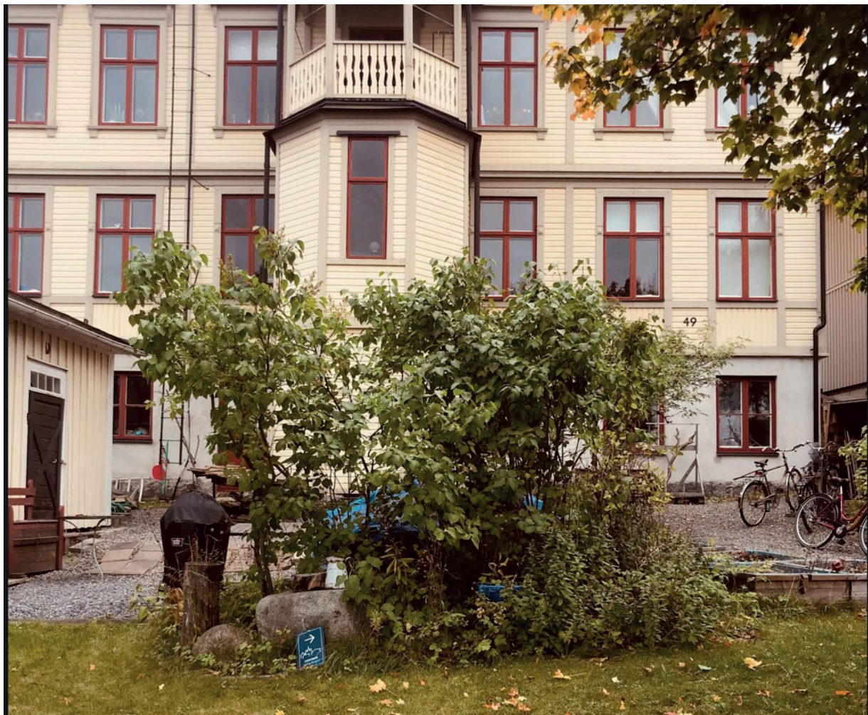
Fasaden mot Skeppsbron nedan.