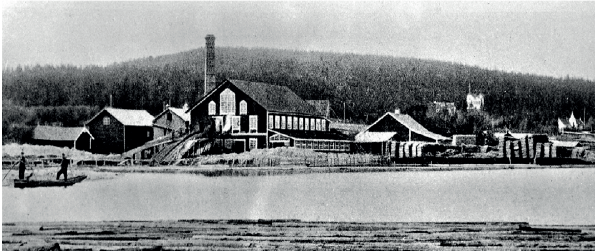
Lövuddens sågverk/ Profilbild Leek Härnösand