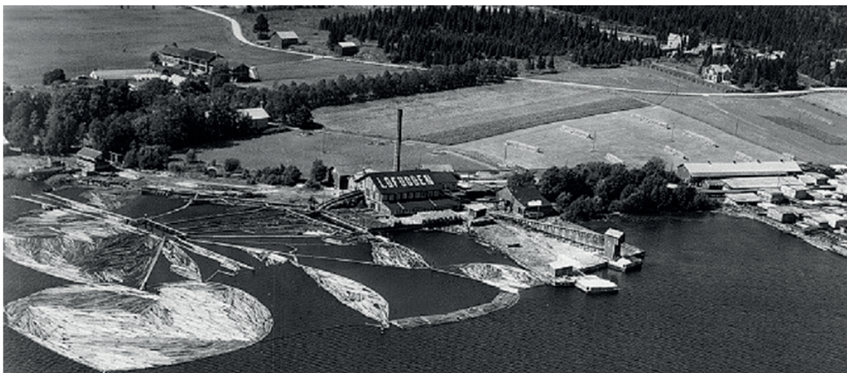
Lövuddens sågverk/ Profilbild Leek Härnösand

Lövudden, Gådeådalen söder om centrala Härnösand, är ett intressant utflyktsmål för såväl Härnösandsbor som besökande. Området omfattar en promenadslänga om 5.5 km via Lövudden – Sparrudden - Gådeån och Sockenvägen. Området har mycket att erbjuda vad gäller natur, kultur och friluftsliv. Här finns även fågeltorn, vindskydd med eldplats, bänkar och bord.