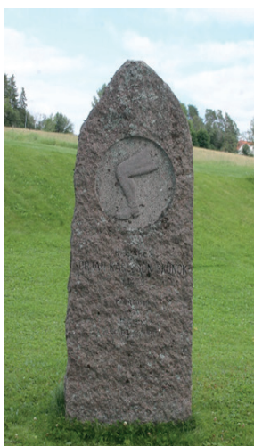
Skanke-stenen vid Hackås gamla kyrka