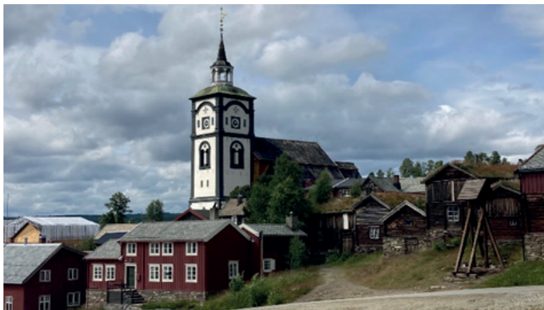
Kyrkan i Røros