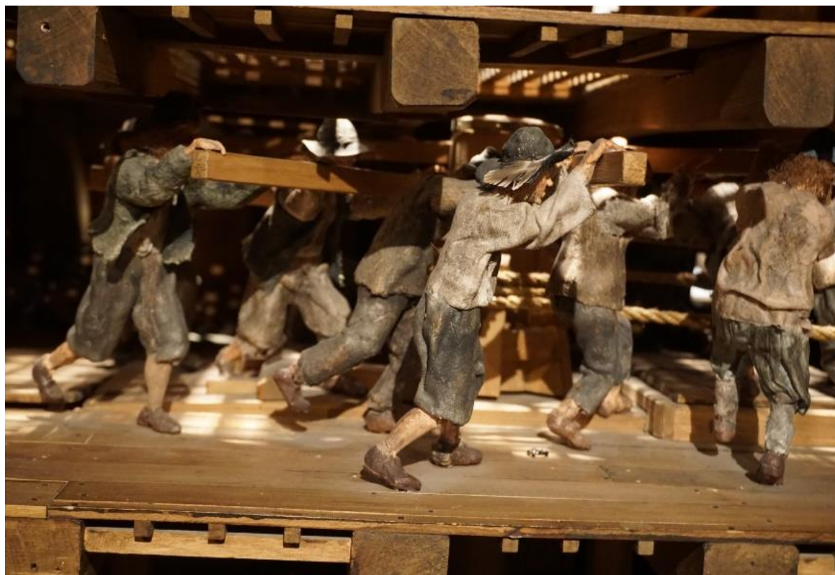
Båtsmän i arbete vid gångspelet. Detalj från modell på Vasamuseet.