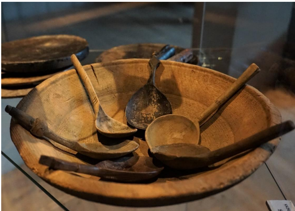
Traskål med sju traskedar från Vasa.

täcken. Från 1680-talet skulle båtsmännen förses med hängmattor och